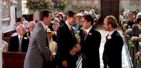
St Peter & Paul's Church, Albury.