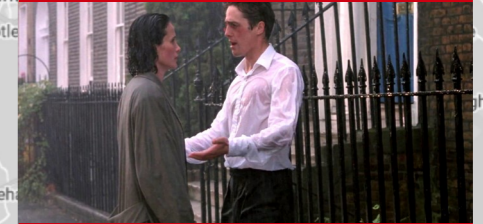
22 Highbury Terrace, Londres.