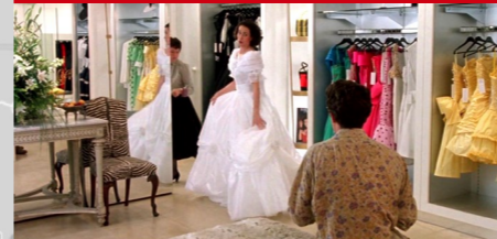
DM Design, 4 Sloane Square, Londres.