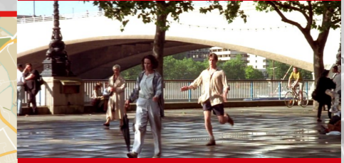
South Bank, Londres.