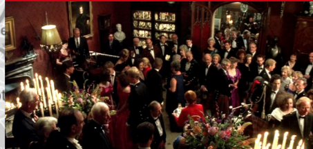
Rotherfield Park Estate, East Tisted.