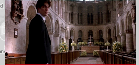
St Bartholomew Church, Barbican, Londres.