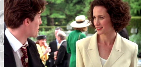
Luton Hoo Mansion House, Luton.