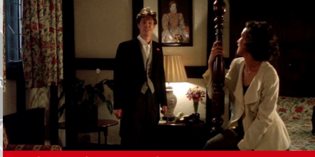
Suite 101, « The Crown », Amersham