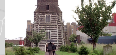
St Clement Church, St Clement Rd, Grays.