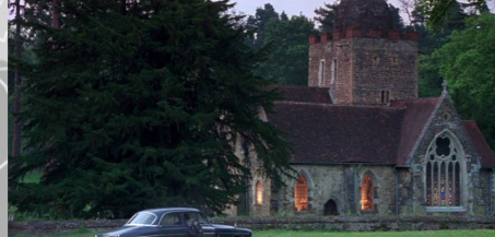
St Peter & Paul's Church, Albury.