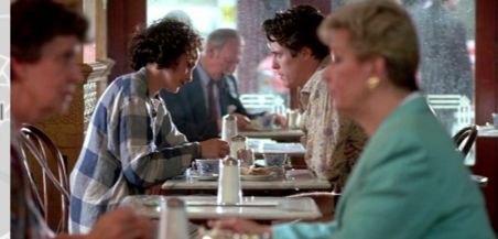
Café Rouge, 34 Wellington St, Covent Garden.