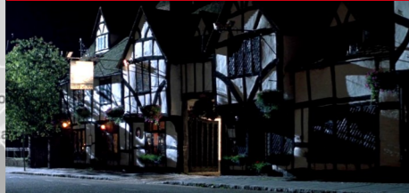
King's Arms Hotel, 30 High Street, Amersham